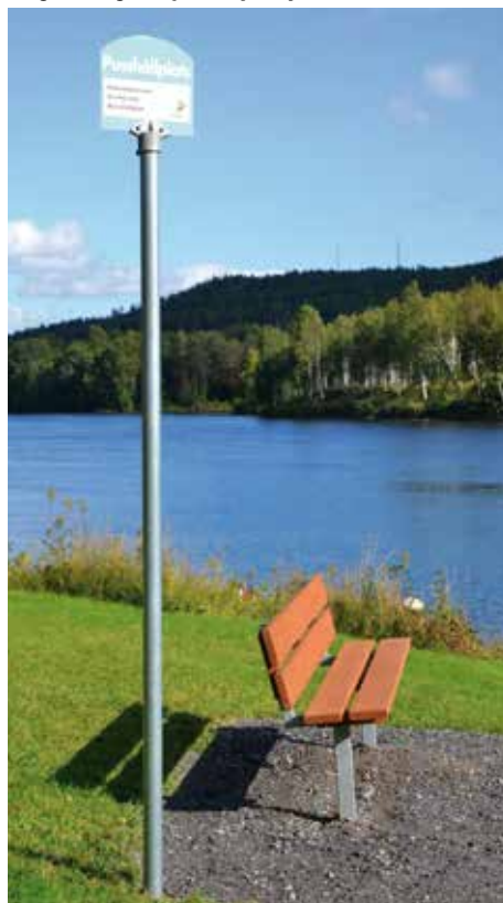
En pusshållplats