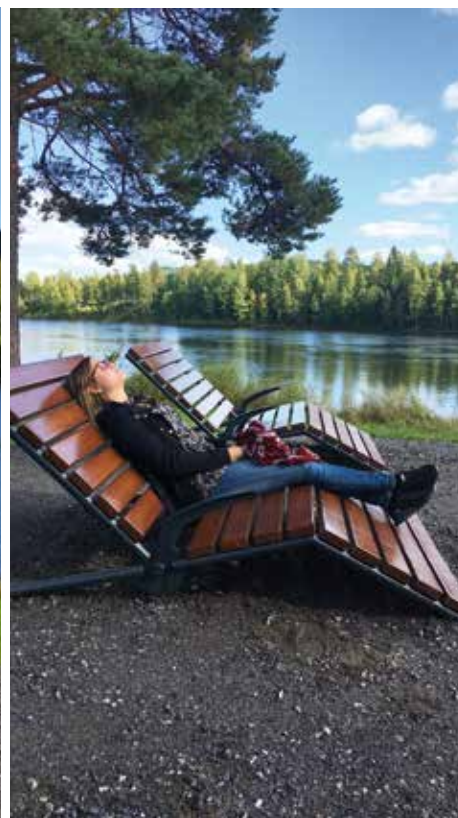
Solsolar vid strandpromenaden