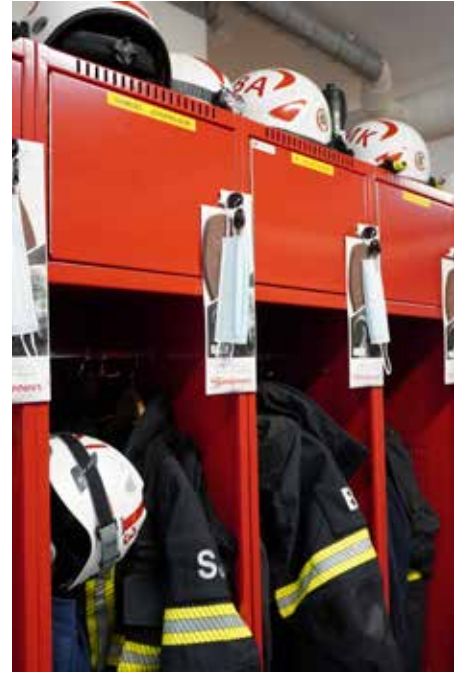
Stora bilden till höger: Ansiktsmasker som filtrerar bort farliga partiklar ur luften. Dessa använder räddningspersonalen när de ska stoppa in använda arbetskläder i tvättmaskinen.