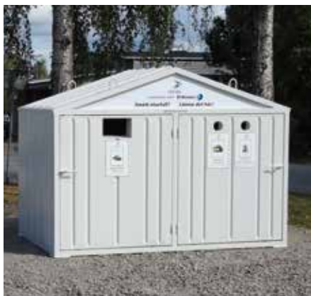
Det står tydligt på ELIS:en vad du kan lämna och i vilket fack.

I ELIS får du lämna alla typer av småbatterier, glödlampor, lågenergilampor, lysrör (max 60 cm långa) och mindre elektronikprylar som exempelvis uttjänta mobiltelefoner, hårtorkar och rakapparater.