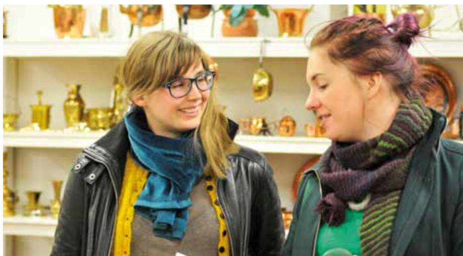
På Returcentrum i Vännäs kan du fynda allt möjligt i secondhand väg exempelvis, skridskor, möbler, porslän, böcker, kläder och massa annat.