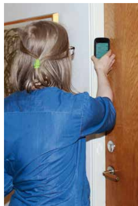
Registreringstaggen sitter på insidan av dörrkarmen.

Registreringstagg – I varje brukares hem har en registreringstagg klistrats på insidan på dörrkarmen. Taggen innehåller information om brukaren och de insatser som ska ges som läses in i smartphonen, samtidigt som klockslaget registreras då personalen kommer och går.