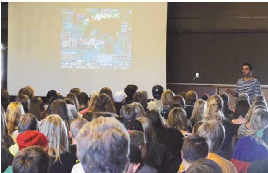
Uppslutningen var stor under temadagen Game Over som arrangerades av Stjärnhuset, Familjecenter, Folkhälso-rådet och Hammarskolan.

Datorn är idag tillsammans med mobiltelefonen det viktigaste redskapet för ungas sociala liv. Internet ger möjlighet att hålla kontakten med vänner du känner och träffa nya både nära och långt bort. På nätet kan du hitta likasinnade. Där kan du bli respekterad för din kunskap eller för ditt intresse.