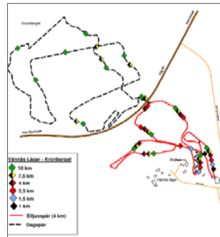
Vännäs läger - Kronberget