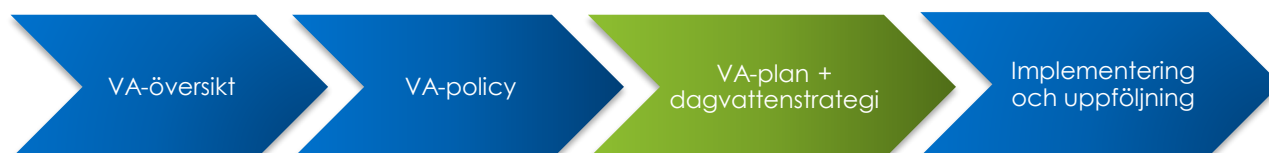
Figur 1. Flödesschema över VA-planeringen. Dagvattenstrategin är en del av det tredje steget i processen.

Tidigare har dagvatten hanterats genom att snabbt leda bort vattnet via ledningar till recipient eller avloppsreningsverk. Detta ställer höga krav vid förändrade flöden i ledningarna - extrema skyfall kan göra att de bli överbelastade med översvämningar som följd. En alltför snabb bortledning av dagvattnet har även som följd att stora mängder föroreningar släpps ut orenat i sjöar och vattendrag. Idag finns kunskapen om att en mer öppen och fördröjd hantering av dagvatten förhindrar den nämnda problematiken. Dagvattnet kan till och med anses som en resurs i mark- och vattenplanering när växtbäddar, dammar eller kanaler skapas i tätorten för att bidra till trivsamma miljöer.