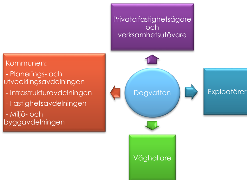
Figur 3. Aktörer som är involverade i dagvattenhanteringen i Vännäs kommun.

Kapitlet behandlar hur dagvattenfrågan ska beaktas vid samhällsplaneringen, d.v.s. översiktsplanering, detaljplaner, bygglovsfrågor, exploateringar och övrig drift och underhåll. Kopplat till detta beskrivs vilken kommunal funktion som är ansvarig, samt vilket ansvar som ligger på privata fastighetsägare, väghållare, exploatörer eller andra aktörer. Kapitlet beskriver även olika aktiviteter som kan påverka dagvattnet och hur dessa ska hanteras.