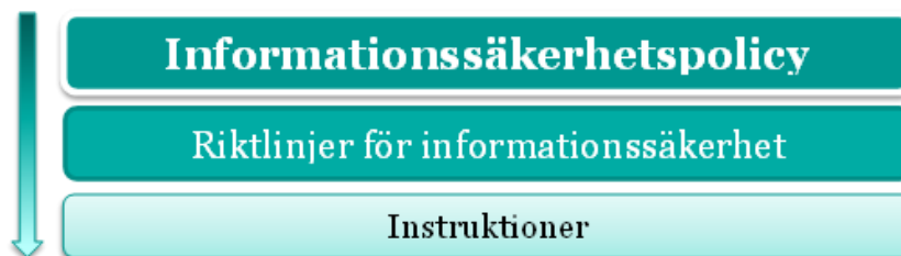
Figur 1. Styrande dokument för informationssäkerhet och dataskydd i Vännäs kommun.

Policyn är ett centralt styrdokument som redovisar kommunens och dess bolags viljeinriktning och mål inom informationssäkerhet och dataskydd samt hur ansvaret i dessa frågor är fördelat. Policyn är styrande för informationssäkerhets-, IT-säkerhets-, och dataskyddsarbetet i Vännäs kommun. Riktlinjer för informationssäkerhet kompletterar och konkretiserar denna policy. Ytterligare kan mer detaljerade instruktioner förekomma och tas fram vid behov som ger verksamheterna stöd i informationssäkerhetsarbetet och bättre förutsättningar för att upprätthålla tillräcklig informationssäkerhet.